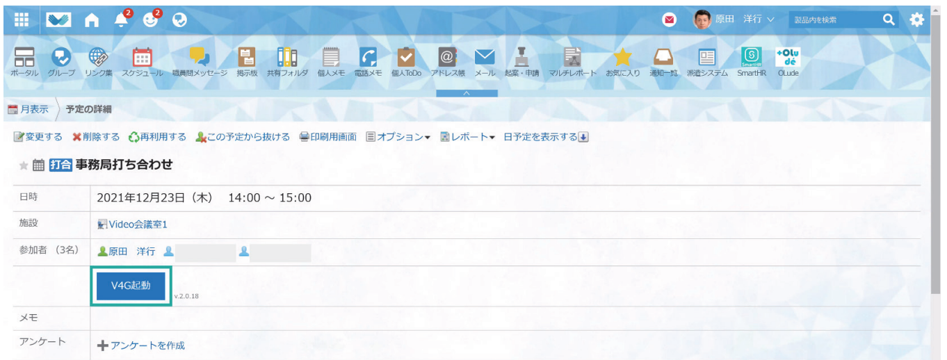
Garoon のスケジュールから 1 クリックで Web 会議を始められる