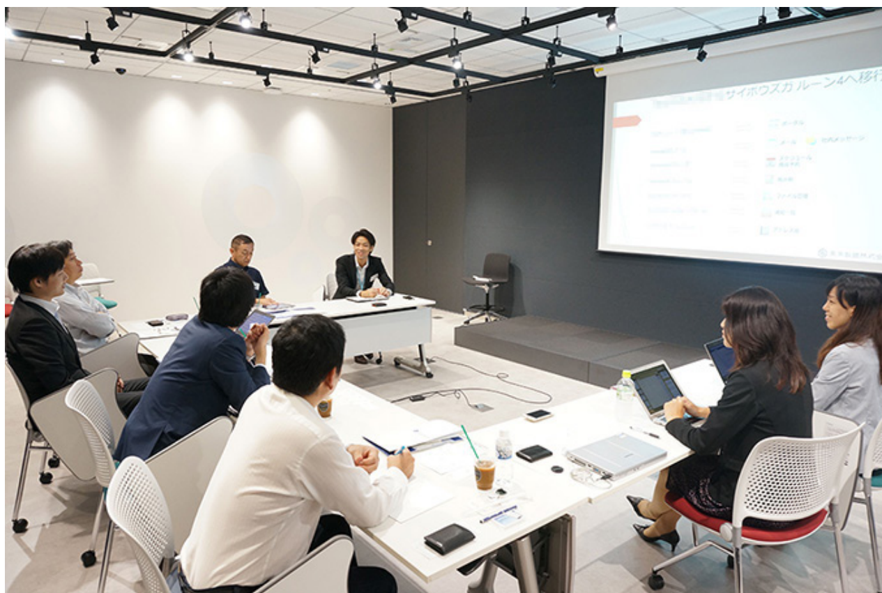
「当日のユーザー会の様子」